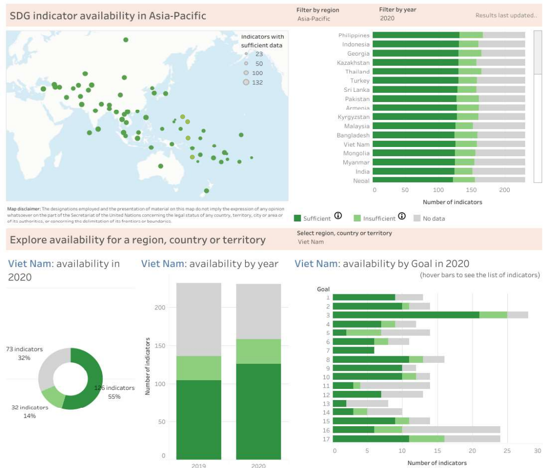
Hình 3: So sánh chỉ tiêu thống kê SDGs của Việt Nam và Khu vực Asia-Pacific 87

Một thực tế, mặc dù Chính phủ rất quan tâm chuyển đổi số và ứng dụng Big data trong quản lý nhà nước nhưng đến nay hạ tầng công nghệ thông tin và cơ sở dữ liệu quốc gia đáp ứng cho hệ sinh thái Big Data chỉ đang trên tiến trình xây dựng và triển khai nhưng chưa đồng bộ, thiếu tính nhất quán và liên thông, chưa tạo được lòng tin của công chúng về bảo mật thông tin. 86 Tại thời điểm viết báo cáo này, tháng 08 năm 2021, các kế hoạch ứng dụng công nghệ thông tin trong hoạt động và phát triển chính quyền số được Bộ ngành và UBND tỉnh/thành lần lượt ban hành đều nhấn mạnh đến yếu tố bảo mật và đảm bảo an toàn thông tin mạng.